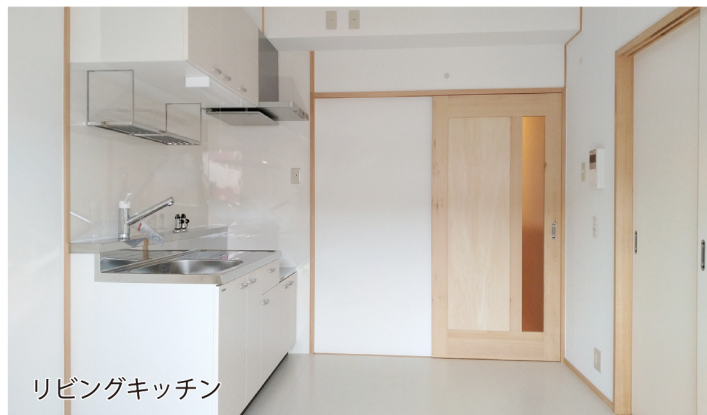
リビングキッチン

鹿児島県が進めてきた原良団地7期Aの8号棟の新築工事が、このほど完成した。建物規模はRC造10階建約3537㎡(60戸)。2DK、3DK。エレベーターの設置のほか台所など、3箇所で給湯が使えるよう採用している。今日、完成した8号棟は1965年に竣工した旧施設の老朽化により解体。23年度から3カ年かけて整備を進めてきた。入居開始は5月初旬を予定している。