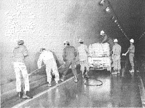
救助活動など行った防災訓練(上)と清掃活動を行う会員ら=瀬戸内町の地蔵トンネルで