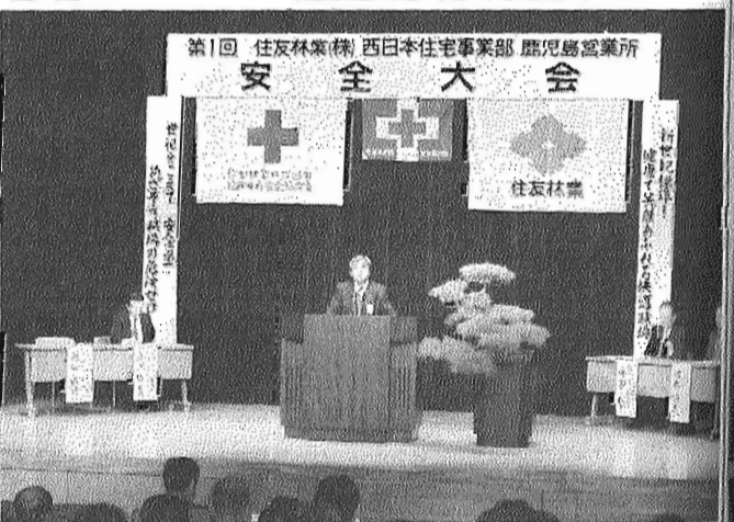
共同作業で無事故無災害を呼びかけた大会 ＝鹿児島市のみなみホールで

また、須賀龍郎県知事も「遺憾なく力を発揮していただき、鹿児島の豊かな自然と文化交流を思い出し」と選手にエールを送った。競技では、各国のトップレベルの妙技が繰り出され観衆の目を引き付けにしていた。また、牧園町での全国育樹祭に出席した皇太子殿下も19日、競技を行啓視察。大会には、加世田建友会員全社が各分野で大きく貢献した。