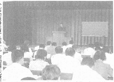
工事成績重視の入札導入が増加する一との講義があった説明会=鹿兒島市の県建設センターで

九州地方整備局は29日、鹿兒島市の県建設センターで公共工事入札・契約制度の最近の状況に関する説明会を開き、不正行為防止のための違約金特例事項の創設、指名停止措置の強化、工事成績の重要性などにについての講義が行われた。 説明会には、九地整の九州地方整備局は29日、鹿兒島市の県建設センターで公共工事入札・契約制度の最近の状況に関する説明会を開き、不正行為防止のための違約金特例事項の創設、指名停止措置の強化、工事成績の重要性などにについての講義が行われた。